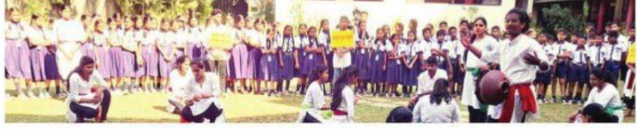
एका शाळेत 'वाहतूक सुरक्षा संस्कृती' पथनाट्य सादर करताना विद्यार्थी.

फोंडा : रस्ते अपघातांची संख्या दिवसेंदिवस वाढत आहे. अनेकांचे बळी या रस्ता अपघातांत जात आहेत. या विषयाचे गंभीर लक्षात घेऊन गोवा विद्यापीठातील शणै गोंयबाब भाषा आणि साहित्य महाशाळेअंतर्गत कार्यरत असलेल्या मराठी अध्ययन शाखेच्या विद्यार्थी पथकाने 'वाहतूक सुरक्षा संस्कृती' या विषयावर फोंडा तालुक्यातील पाच शैक्षणिक संस्थांच्या आवारात पथनाट्याचे सादरीकरण करून या विषयाबाबत जागृती केली. प्रत्येक वेळा अपघात टाळता येईल असे लक्षात घेऊन जागृती करून देण्यात आली.