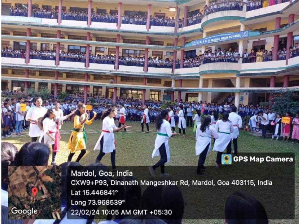
Street Play on Road Safety at School in Mardol on 22-02-2024