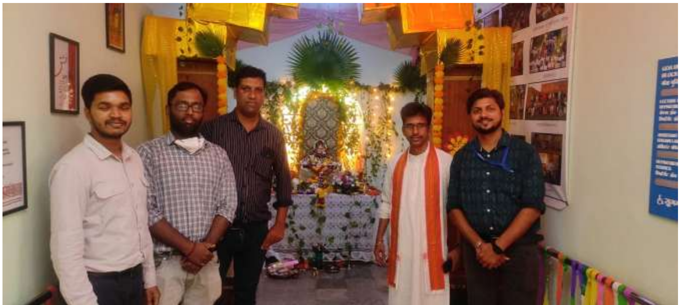
Administrative staff participated in Sharadotsav