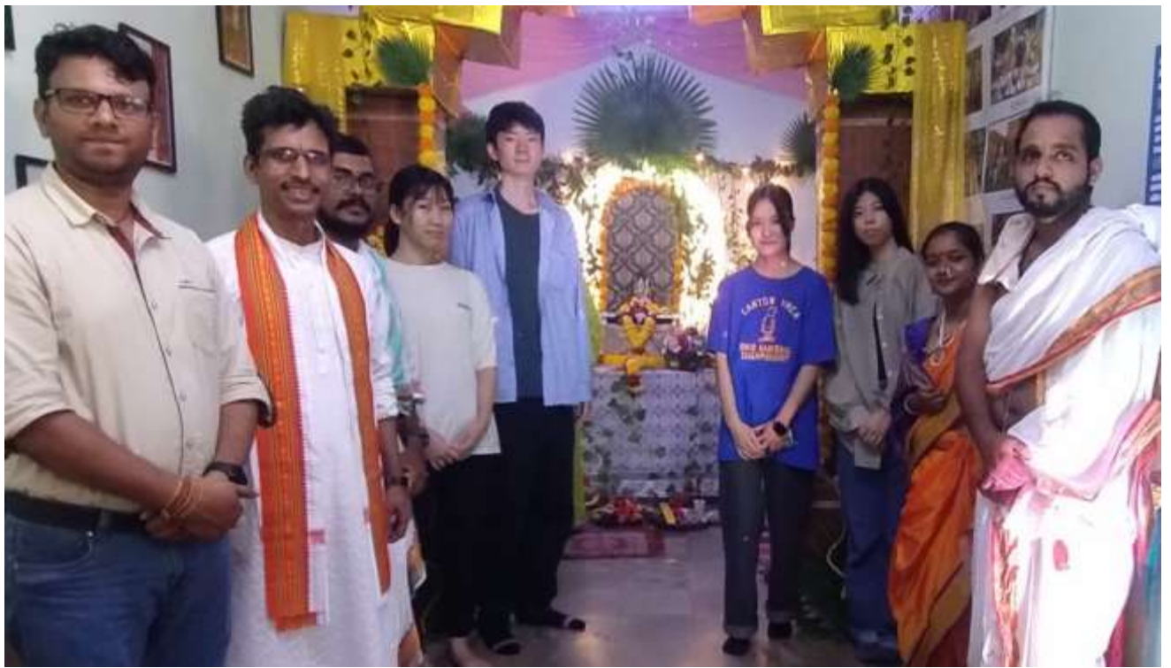
'Annual Sharadotsav' was very enlightening for Japanese students who visited Goa University as part of the 'Study India Programme'.