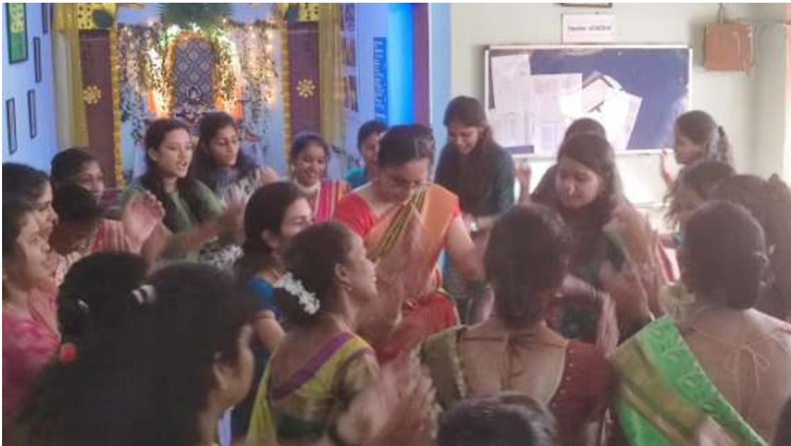
After Sharada Pujan students across Disciplines and Schools performed 'Fugdi', 'Ghumat Aarti', 'Bhajan' and 'Dindi' as a part of 'Sharadotsav'.