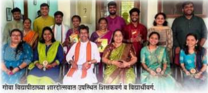
गोवा विद्यापीठाच्या शारदोत्सवात उपस्थित शिक्षकवर्ग व विद्यार्थीवर्ग.