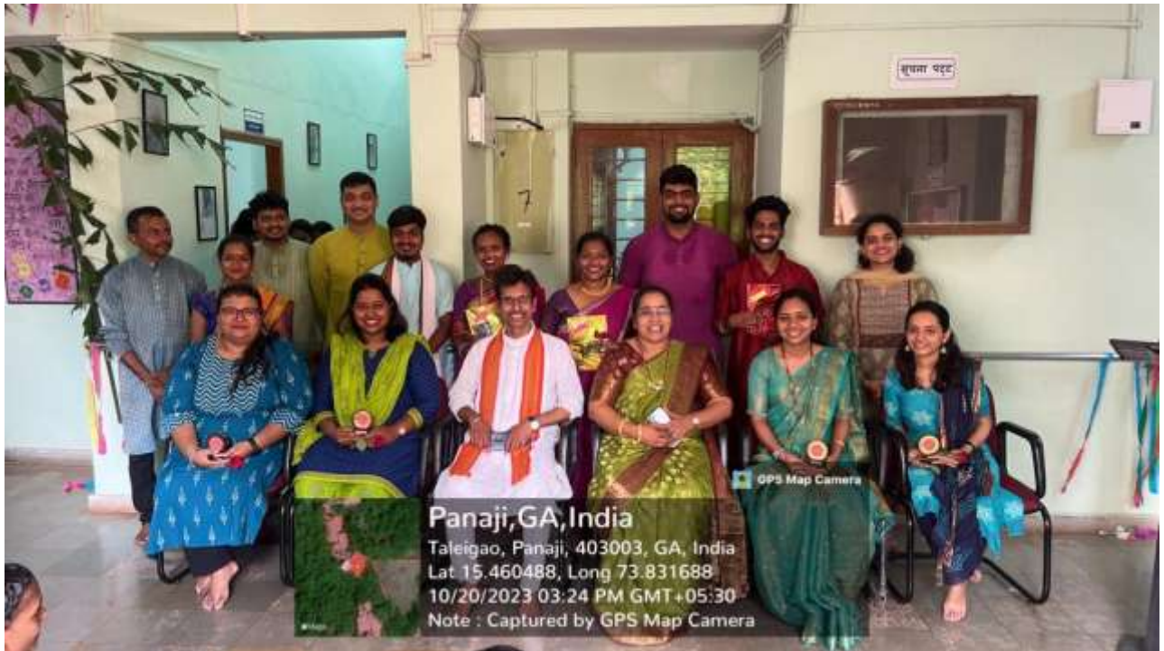
Honoring students who have passed NET exam in Marathi subject